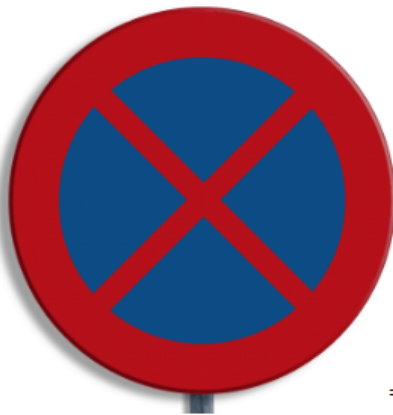
= Verkeersbord E02