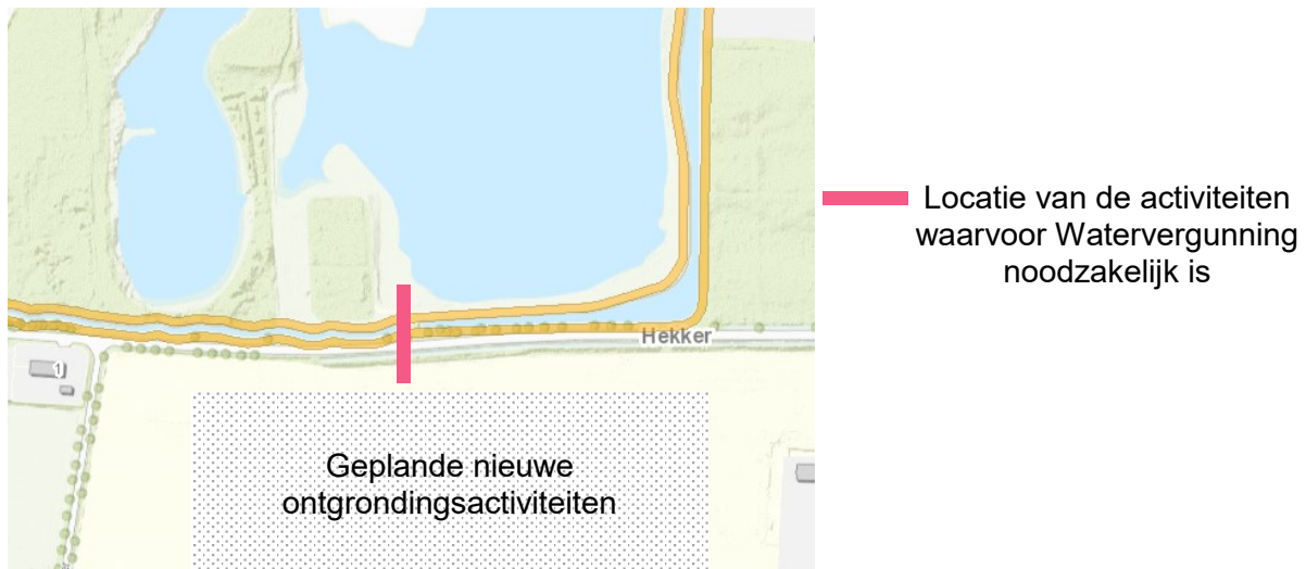
Afbeelding 1 Locatie van de activiteiten

Rondom deze waterloop is aan beide zijde van de loop een beschermingszone op grond van de Keur waterschap Aa en Maas 2015 van toepassing. Met uitzondering van beheer- en onderhoudsaspecten is geen specifiek beschermingsbeleid van toepassing op de aangevraagde activiteiten. Zie afbeelding 1.