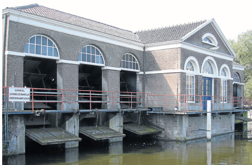
Cultureel erfgoed van Haarlemmerliede en Spaarnwoude: Museum Stoomgemaal Halfweg.