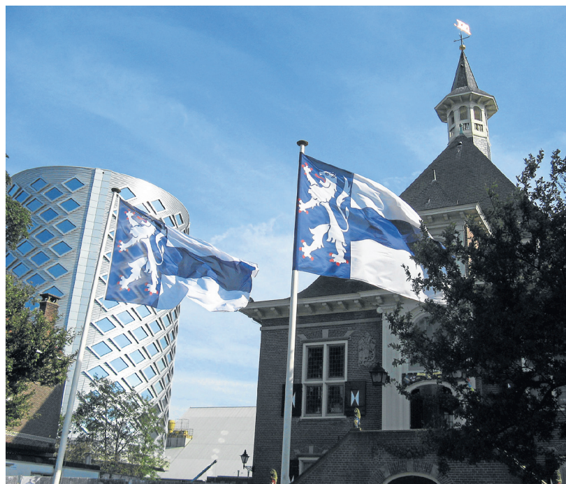
Het gemeentehuis van Haarlemmerliede en Spaarnwoude in Halfweg.

Heeft u vragen of opmerkingen aan de gemeente Velsen over de mogelijke fusie? Stel ze gerust. Dit kan via Facebook of communicatie@velsen.nl. Ook is er op dinsdag 17 mei tussen 19.30 en 21.00 in de burgerzaal van het gemeentehuis gelegenheid om vragen te stellen aan raadsleden en collegeleden.