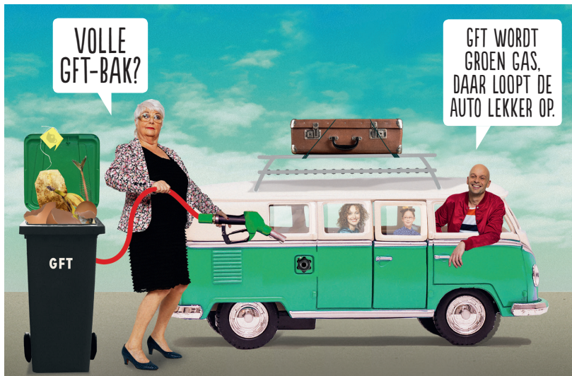
Afval scheiden. Samen halen we eruit wat erin zit. HVC

Wist u dat een oude broodkorst, etensresten of een restje vanillele van alles in beweging kan zetten? Het gescheiden gft gaat naar de HVC vergistingsinstallatie om te vergisten. Tijdens dit vergistingsproces