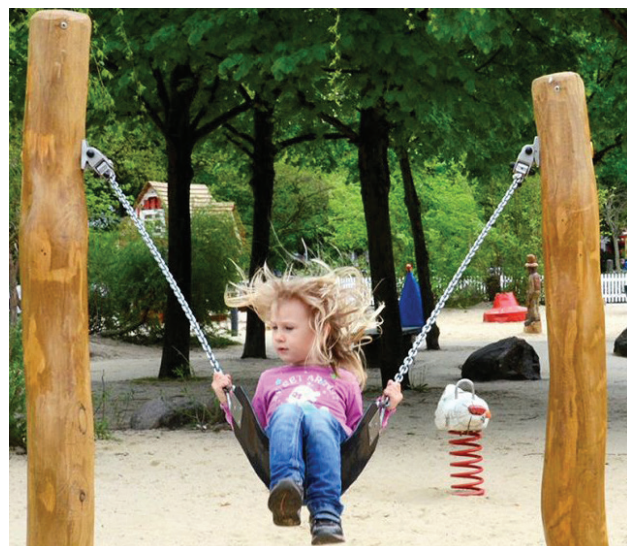
1. kleine schommel met bandzitje (referentie)