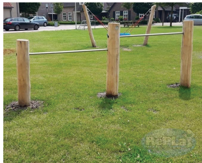
2. 2-delig duikelrek, stanghoogte 80 en 120 cm