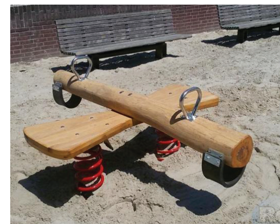
4. pipo wip