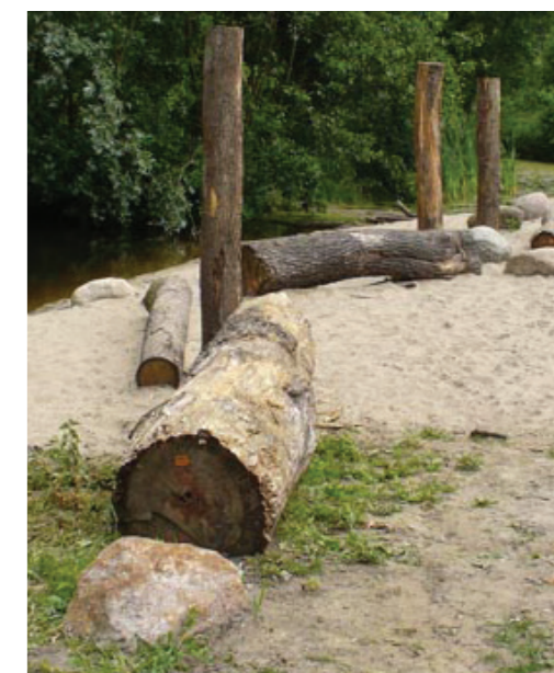
4. zwerfkeien en stammen op heuvel