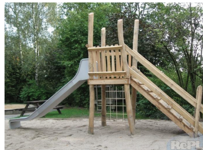
3. toren met klimnet, klimwand en glijbaan, glijhoogte 1.50m