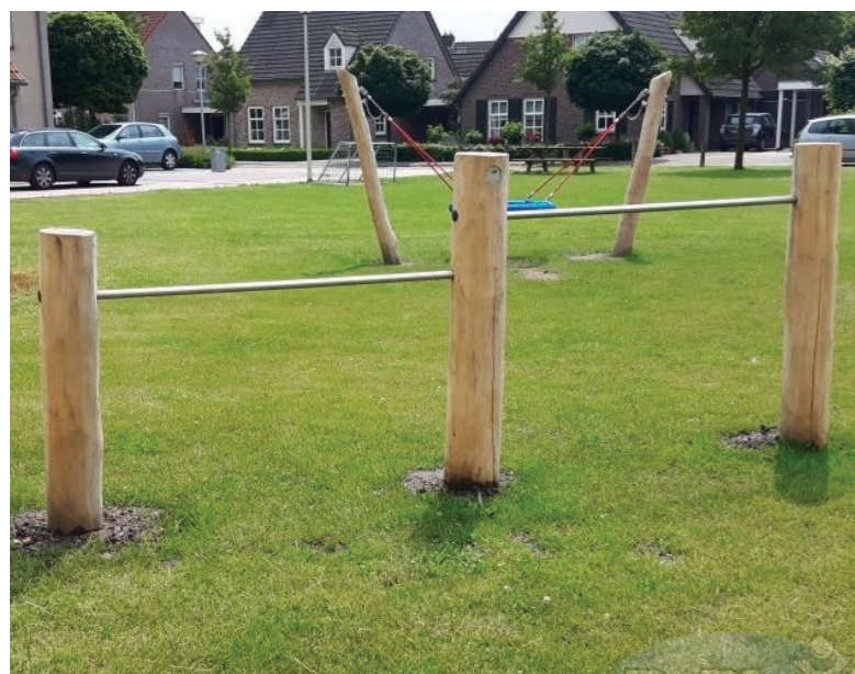
1. 2-delig duikelrek met stanghoogte 1.20 en 1.50 meter