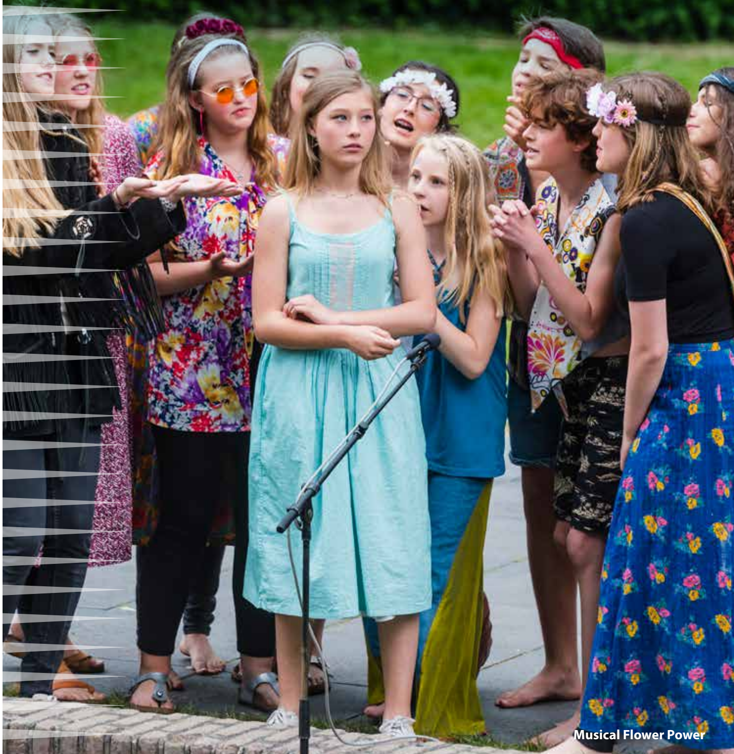
Musical Flower Power

Een levendig cultureel klimaat met vitale culturele spelers 11