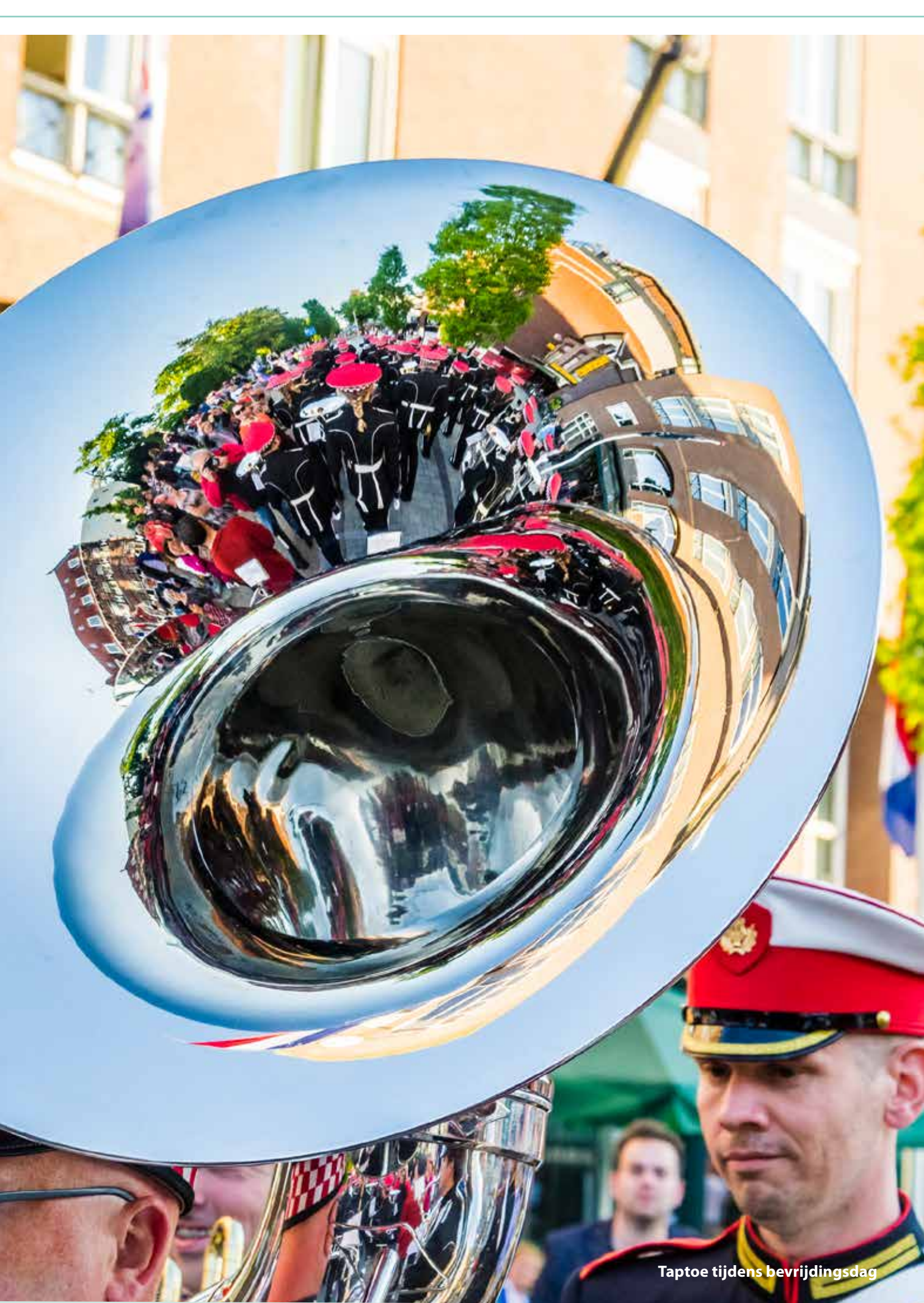
Taptoe tijdens bevrijdingsdag