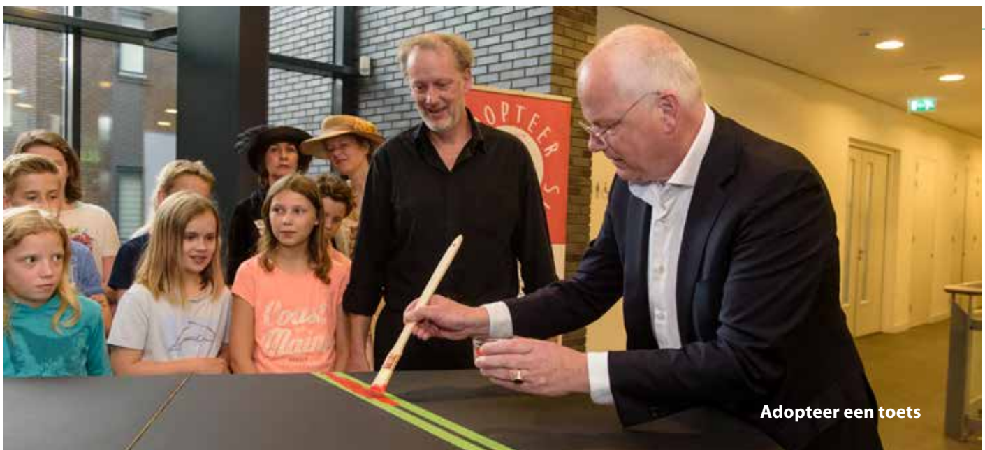
Adopteer een toets

De Cultuurvisie beslaat de periode van 2017 tot en met 2020. Tegen het einde van 2020 bepalen we of er, gezien de bereikte resultaten en de ontwikkelingen in sector en samenleving, een nieuwe visie nodig is of dat een actualisatie volstaat. In de tussentijd monitoren we door middel van jaarprogramma's en jaarverslagen de voortgang en resultaten van ons beleid. 6