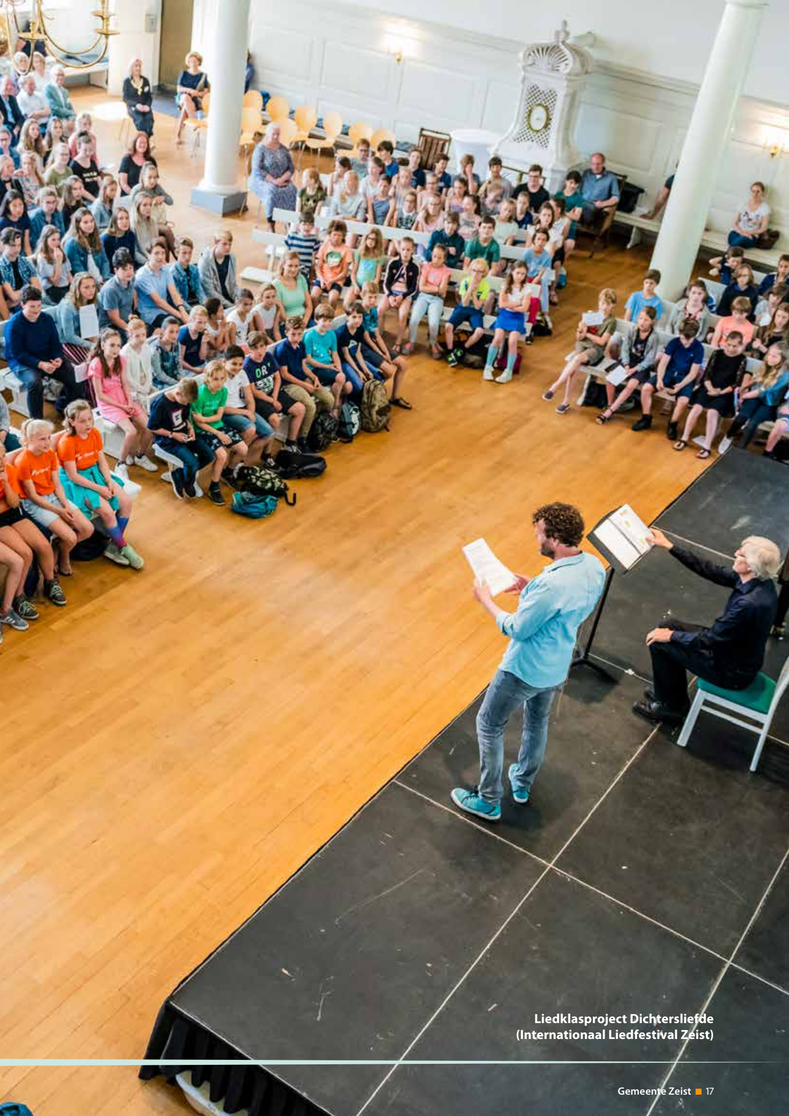
Liedklasproject Dichtersliefde (Internationaal Liedfestival Zeist)