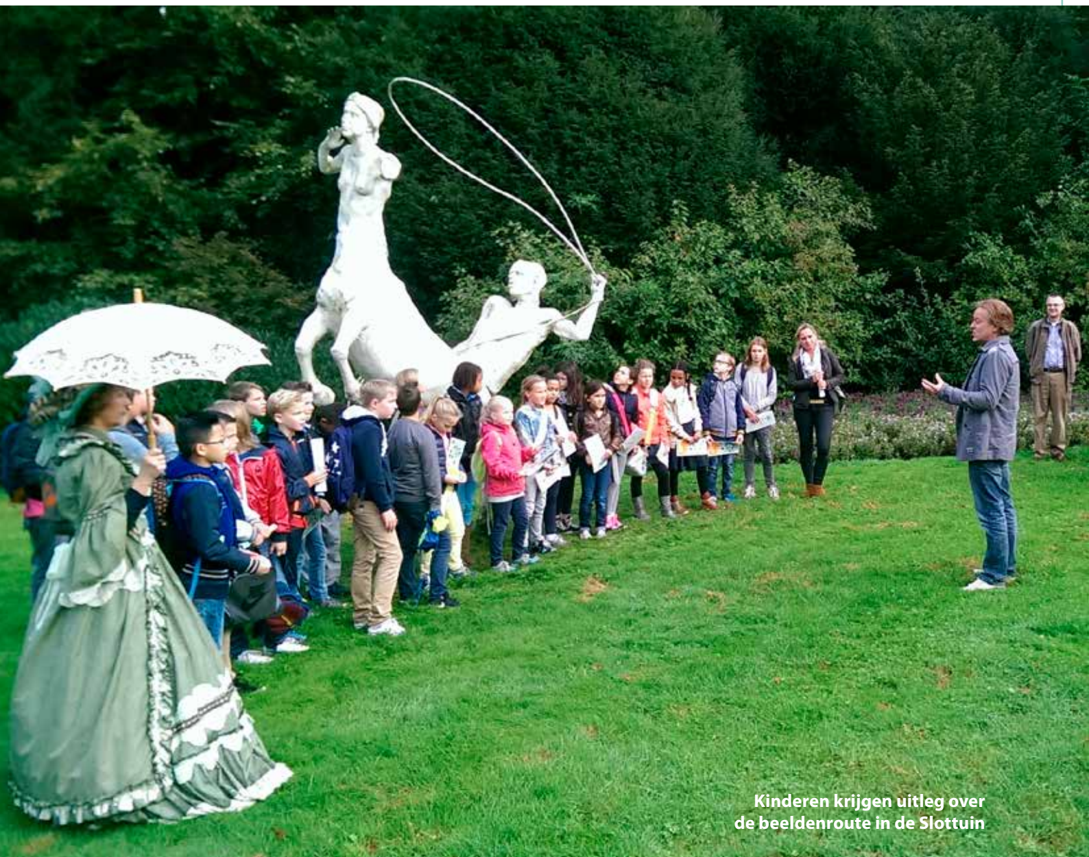
Kinderen krijgen uitleg over de beeldenroute in de Slottuin

In tussentijdse terugkoppelingen en in de eindevaluatie staan deze punten centraal. Zo houden we goed zicht op de uitvoering van deze visie en kunnen we daarop indien en waar nodig bijsturen.