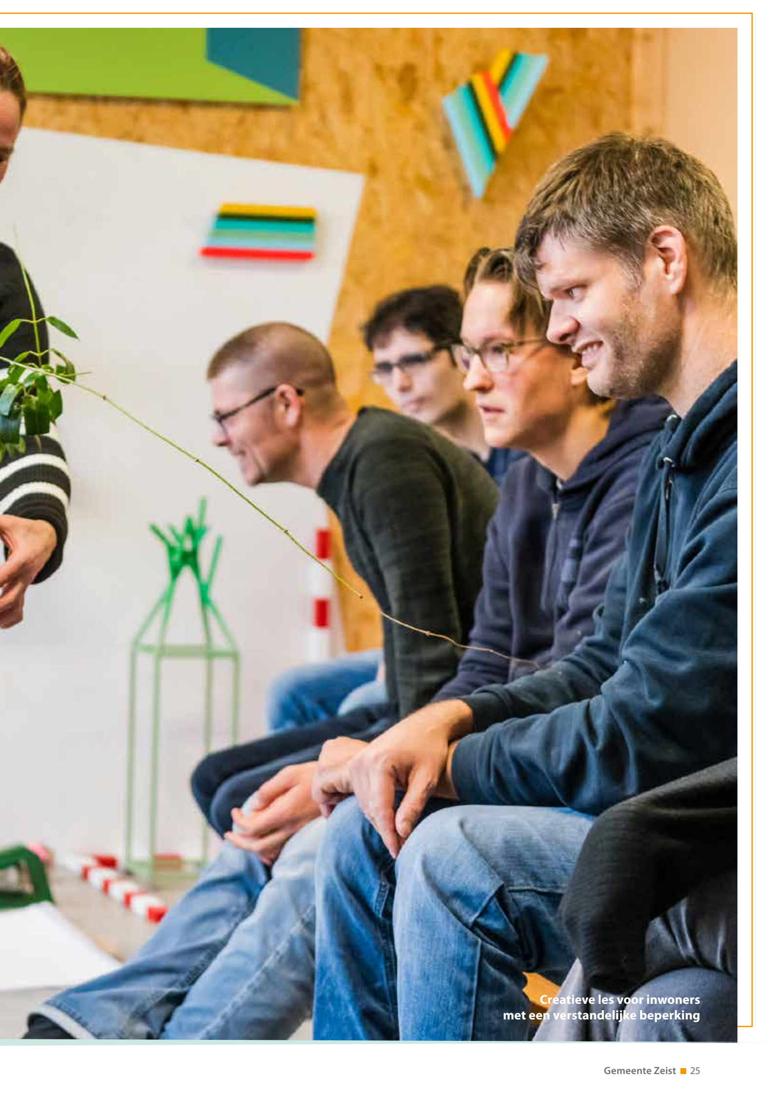
Creative les voor inwoners met een verstandelijke beperking