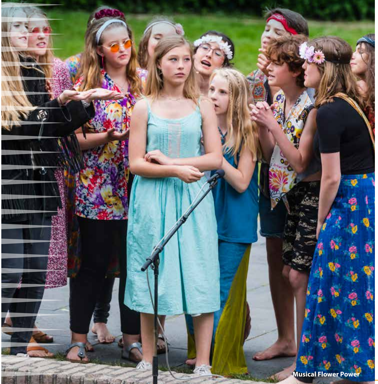
Musical Flower Power

Een levendig cultureel klimaat met vitale culturele spelers 11