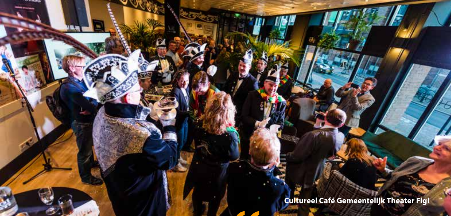
Cultureel Café Gemeentelijk Theater Figi