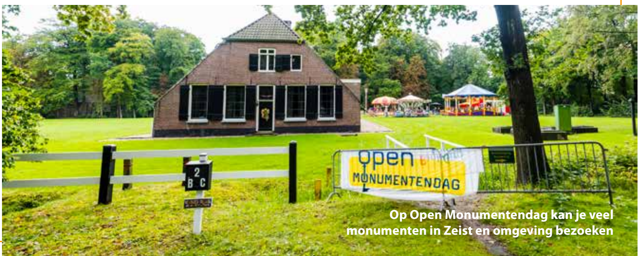
Op Open Monumentendag kan je veel monumenten in Zeist en omgeving bezoeken