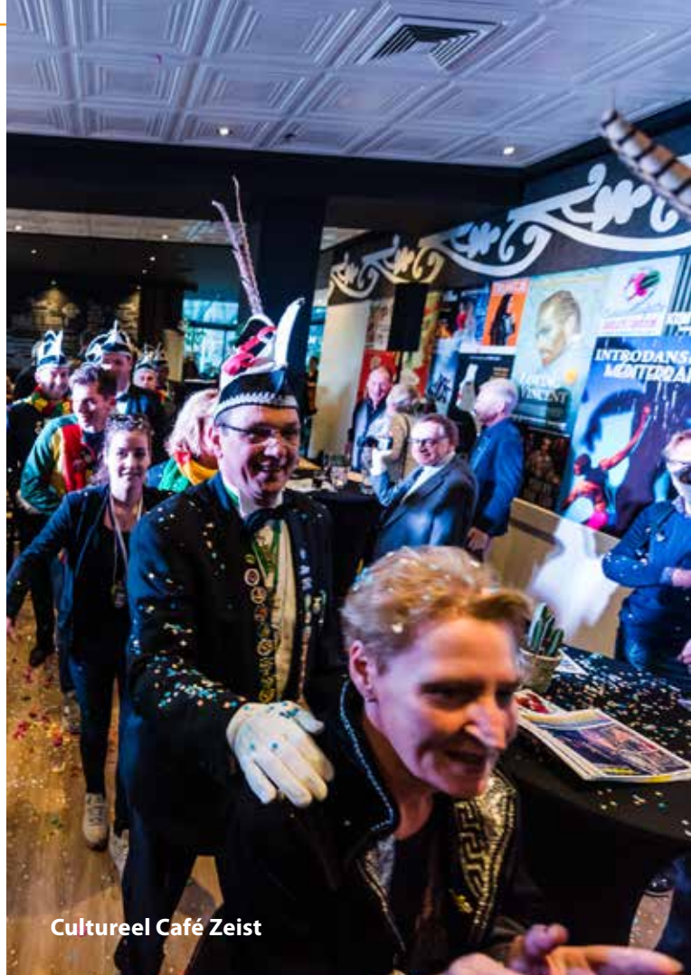
Cultureel Café Zeist

Voor de financiële drempels zijn er, zoals hierboven beschreven, voorzieningen en regelingen beschikbaar. Het overige is voor een belangrijk deel een kwestie van het tegemoetkomen aan de wensen en behoeften van nieuwe en/of relatief onbekende publieksgroepen. Wij vinden het onze verantwoordelijkheid om de culturele sector, de door ons ondersteunde instellingen voorop 23 , hierin een zetje te geven. Hen te bepalen bij de vraag wat het gemakkelijker maakt voor mensen om deel te nemen aan het culturele leven en hoe je dat kunt organiseren. Hen aan te zetten tot vraaggericht werken, behoefteonderzoek, meer en betere communicatie en het vergroten van de zichtbaarheid van hun activiteiten.