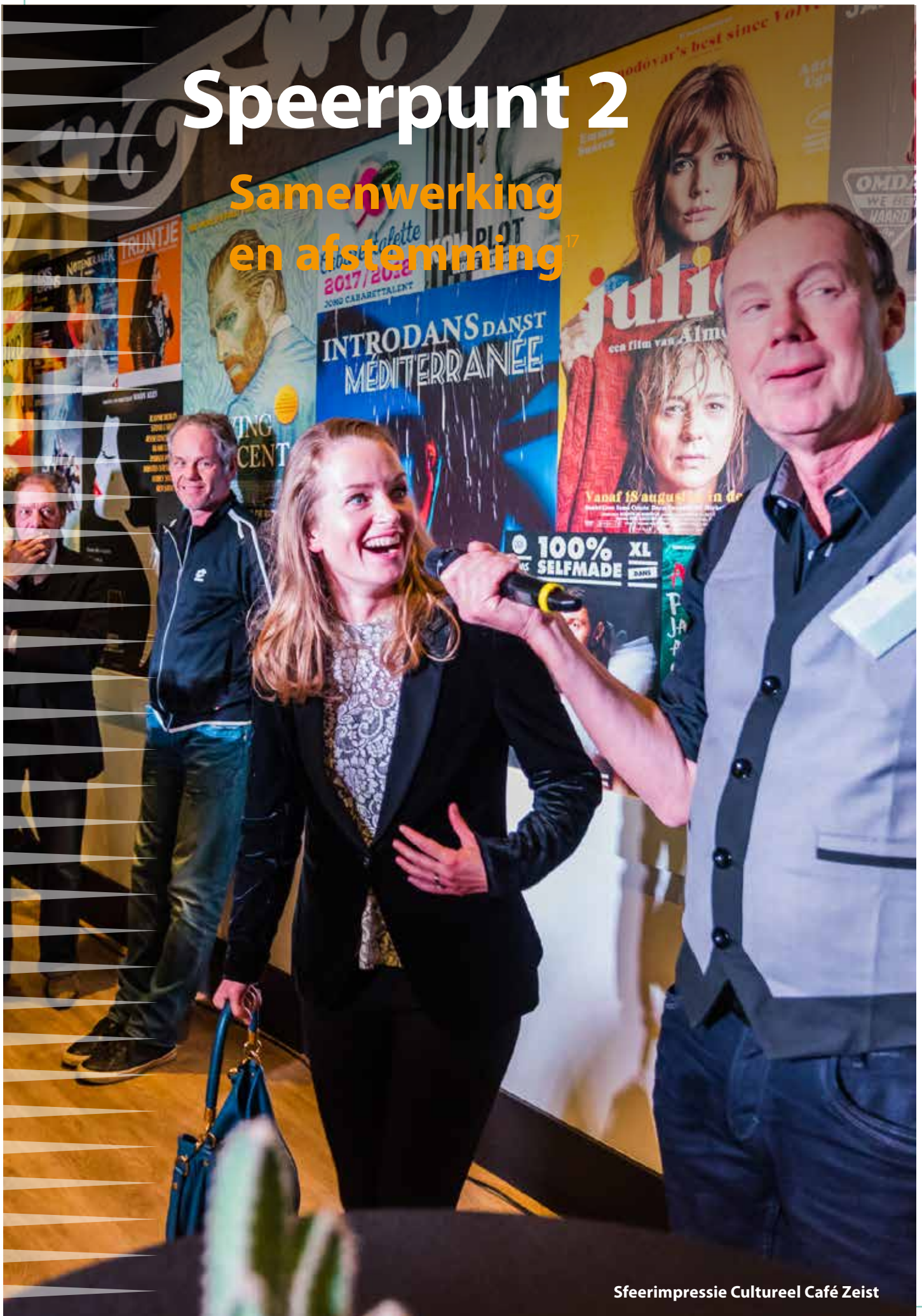
Sfeerimpressie Cultureel Café Zeist