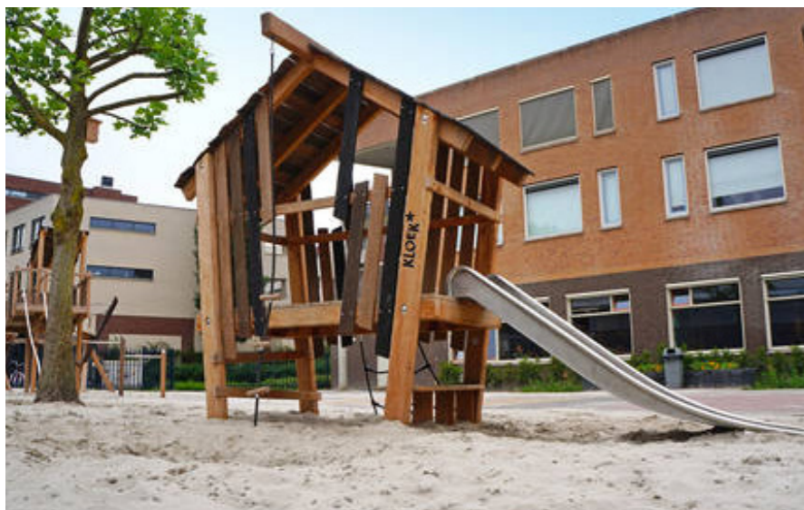
1. toren met glijbaan, glijhoogte 1 meter.