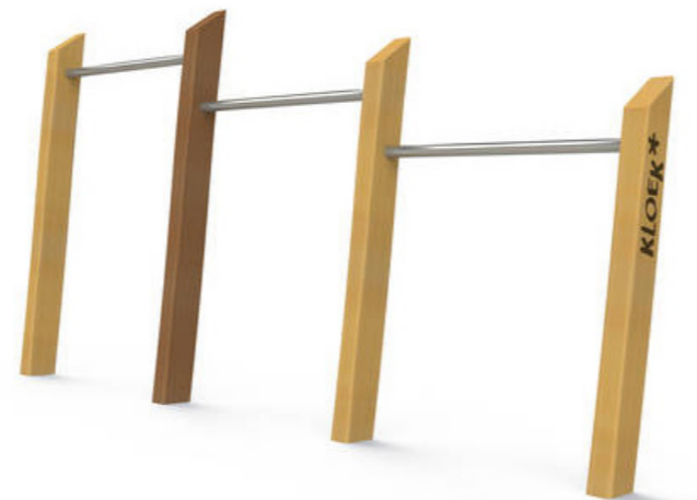
3. 3-delig duikelrek, hoogste stang 1.40 meter