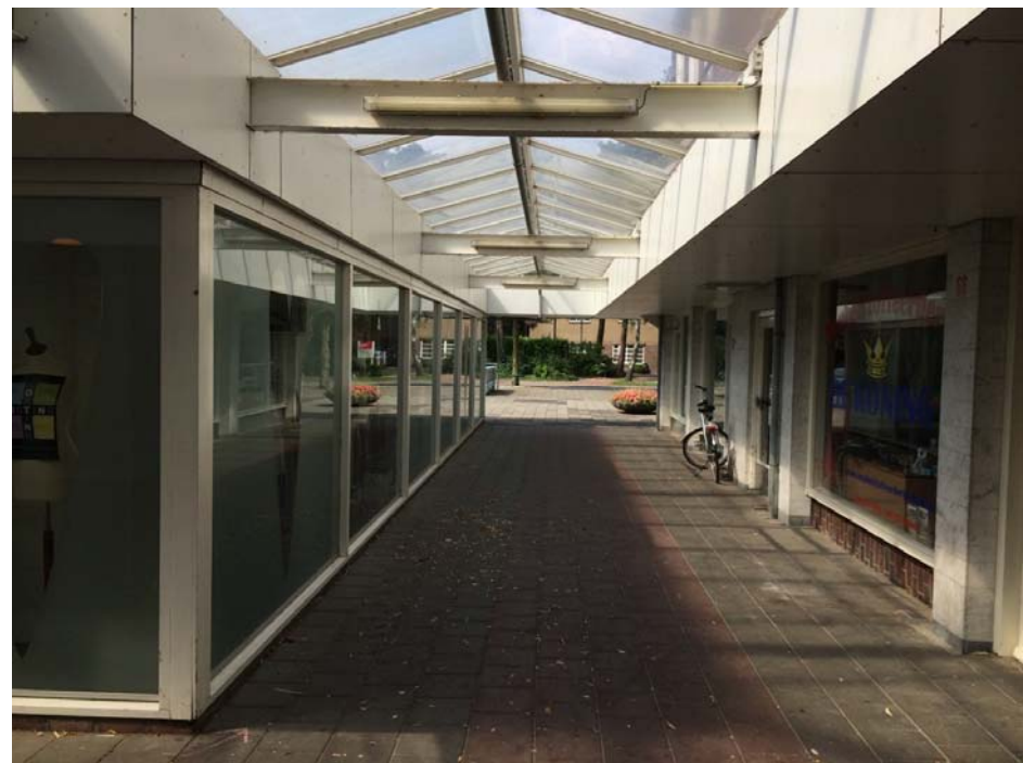
Bestaande situatie winkelcentrum Kerckebosch