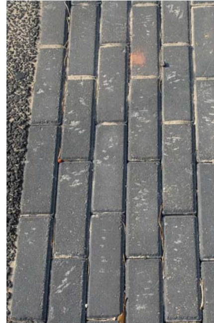
PARKEREN betonstraatsteen – antraciet met basaltsplittoplaag