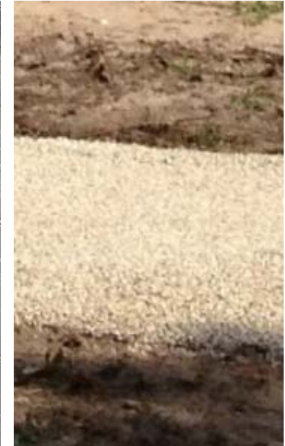
WANDELPADEN asfaltpad met parelgrind