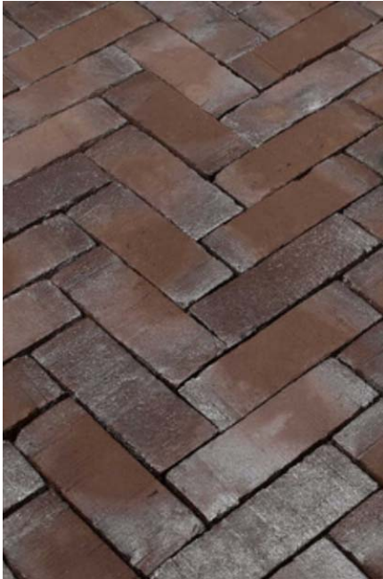
RIJWEG straatbaksteen – dikformaat, Wienerberger, kleur: Juist