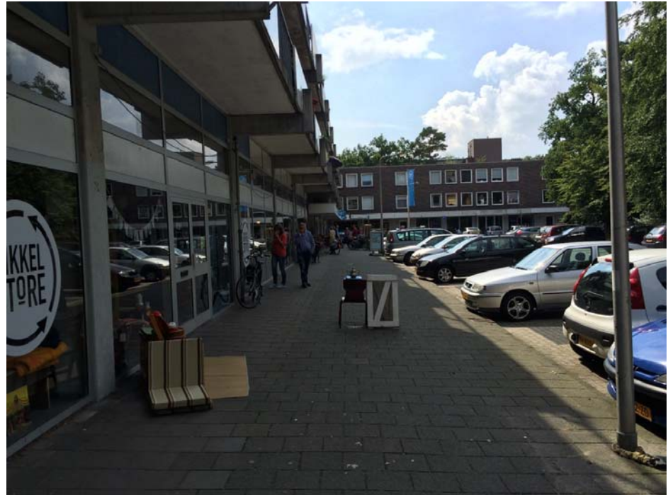
Bestaande situatie winkelcentrum Kerckebosch