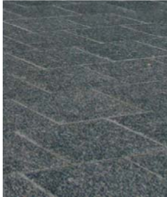
WINKELPLEIN betontegels – 20x20, Struyk Verwo, antraciet met basaltsplittoplaag