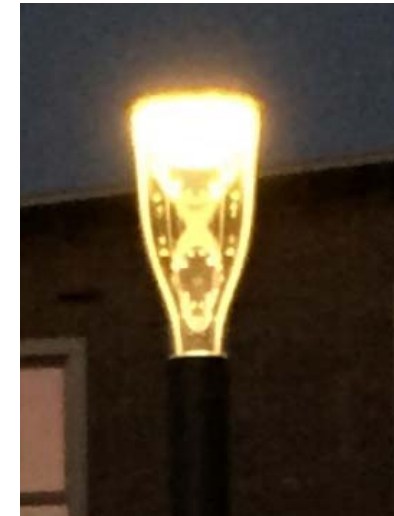
Paaltopmaast – Metronomis Torch LED