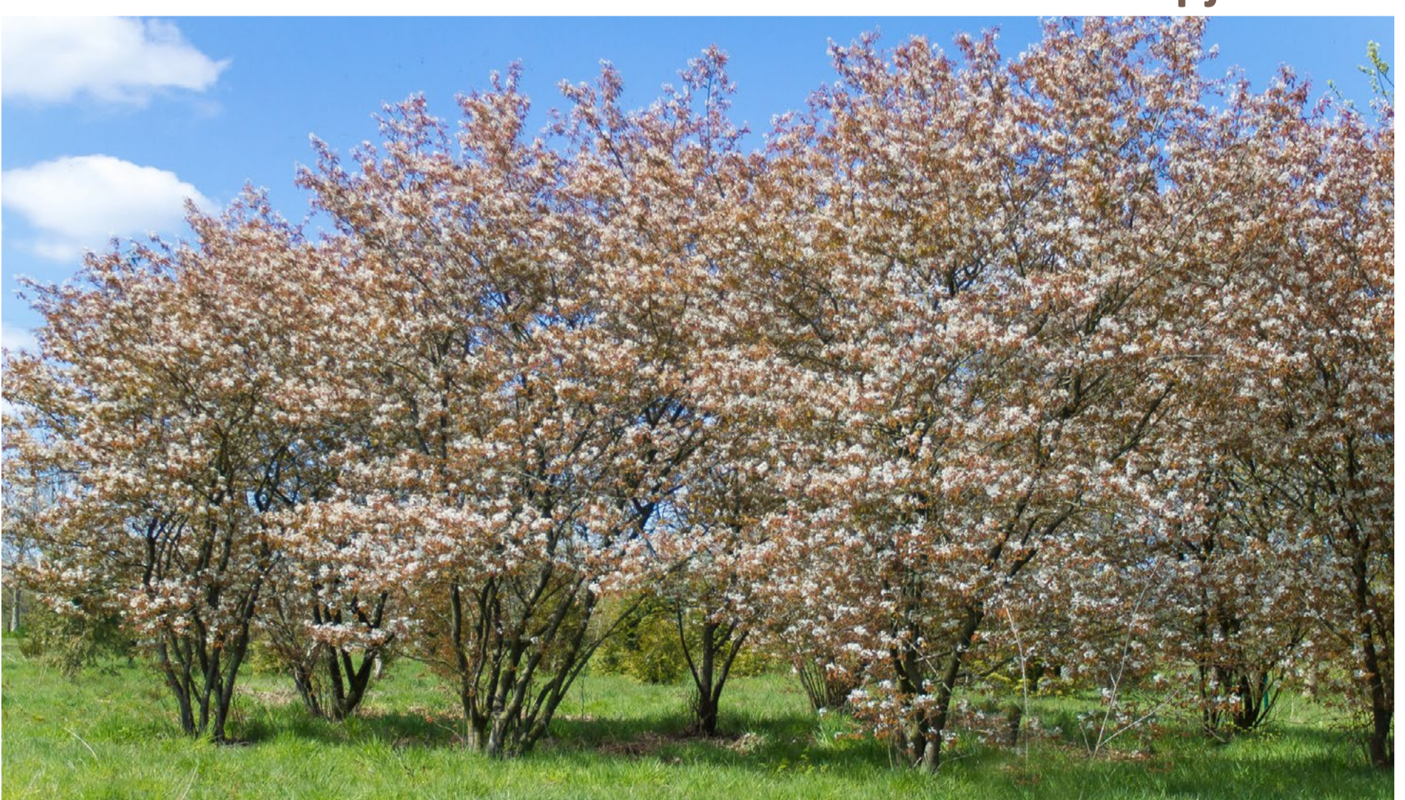
solitaire heester: Amerikaans krentenboompje