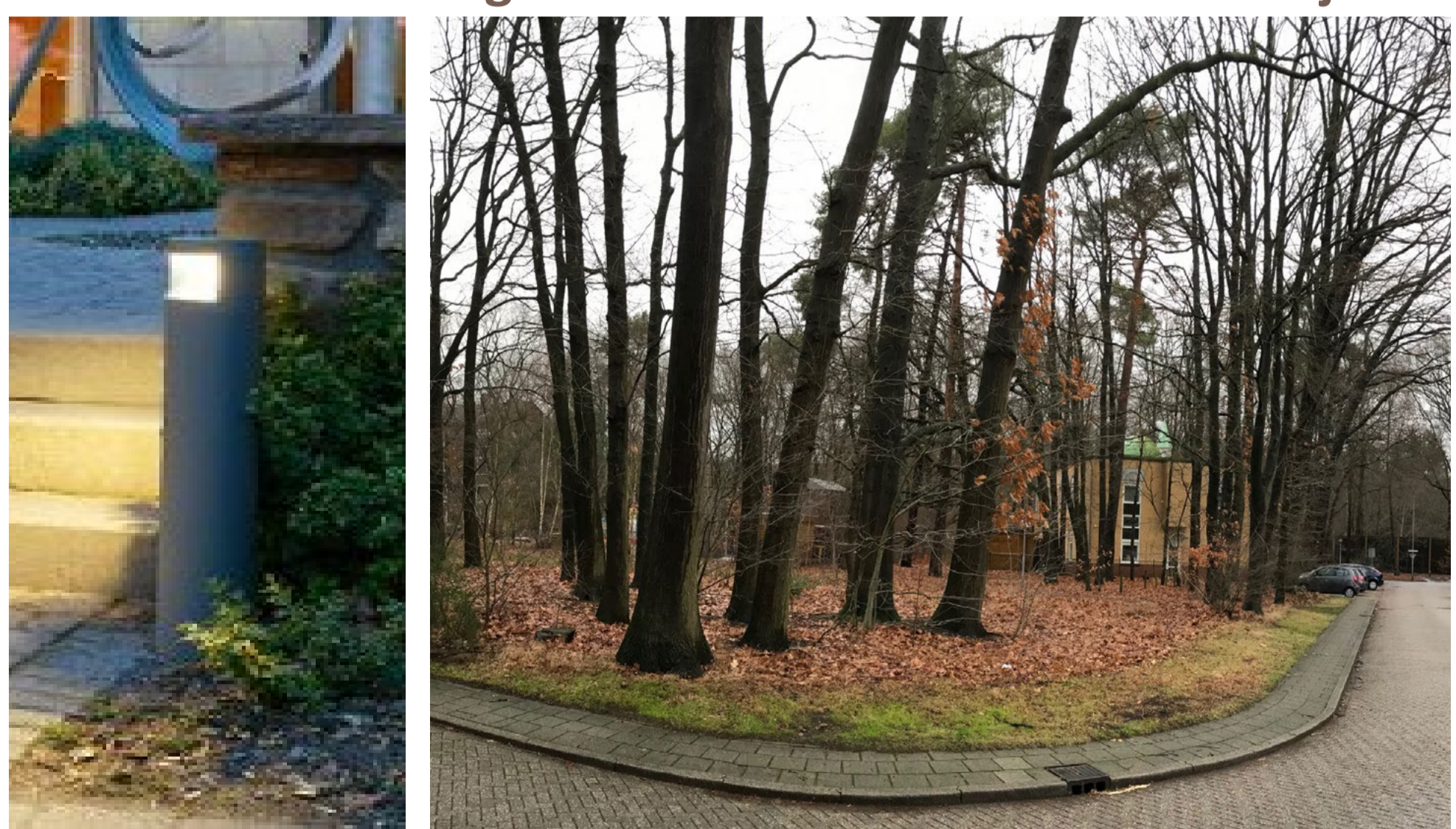
bolderverlichting tbv 'donker' houden van het bosje