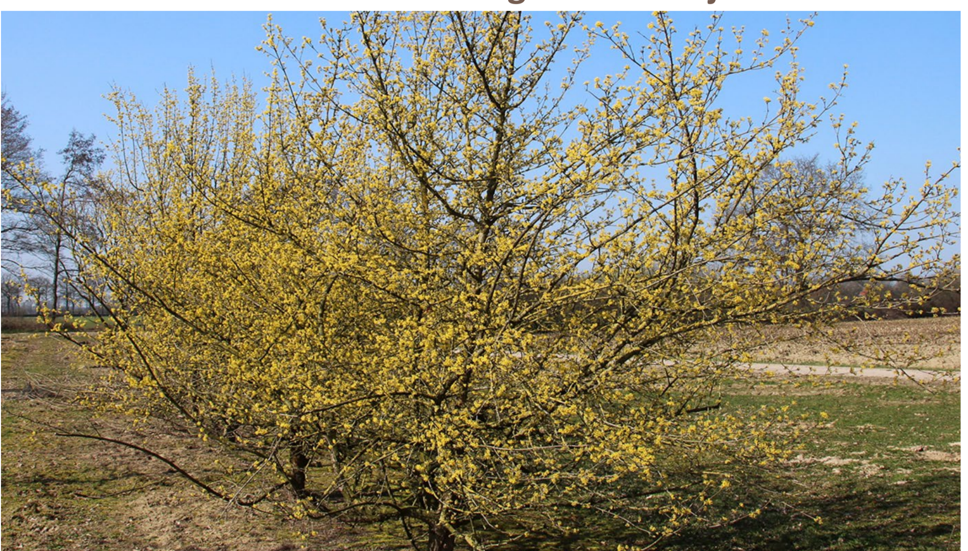
solitaire heester: gele kornoelje