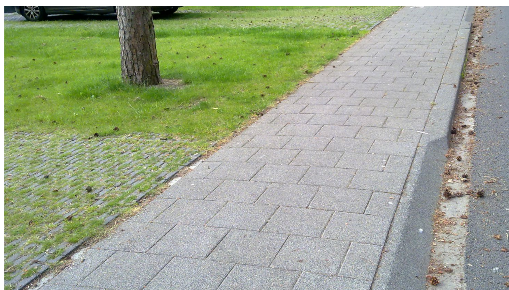
referentie: trottoir met inritbanden