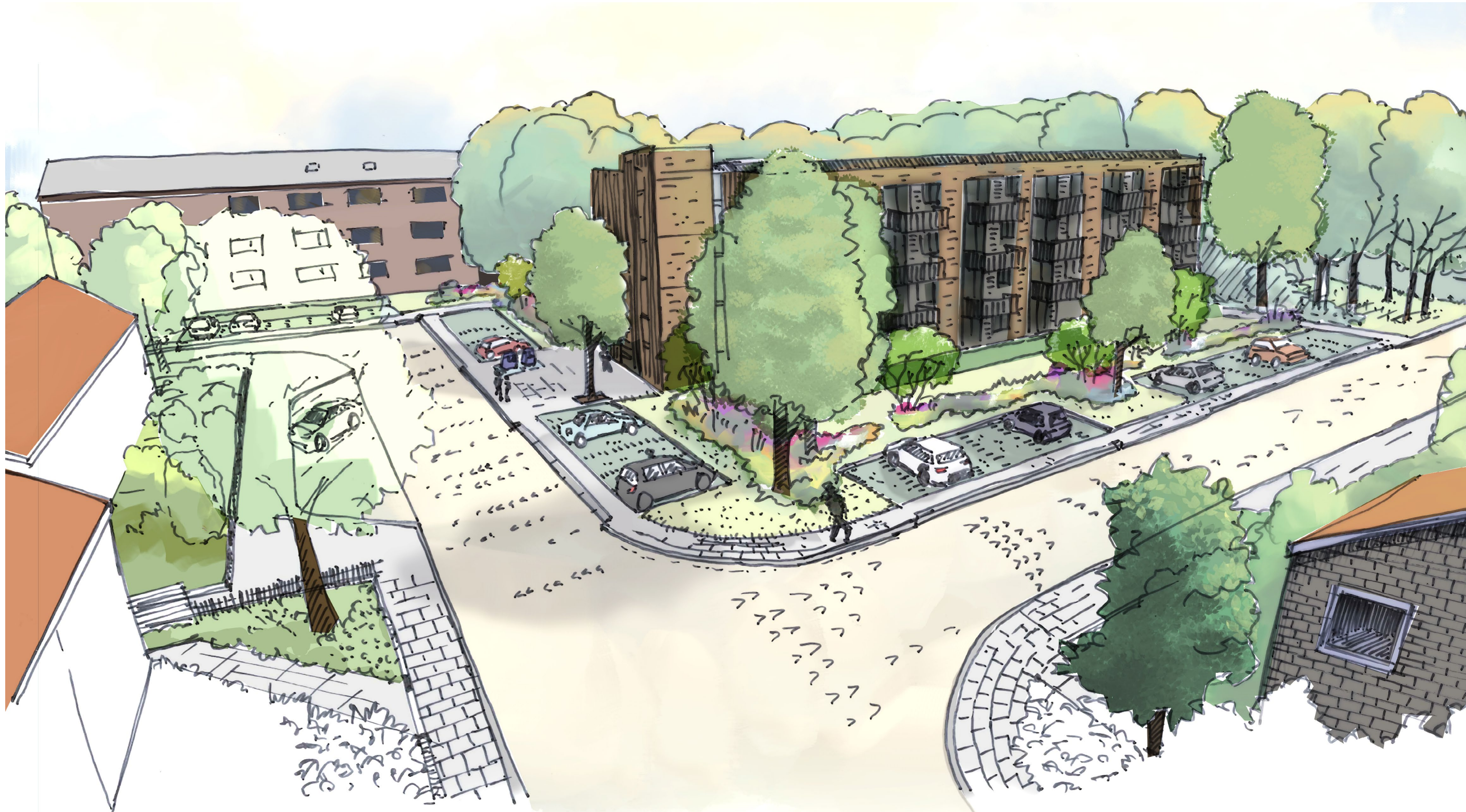
Vogelvlucht Cornelis Vlotlaan vanuit de Leendert Edelmanlaan