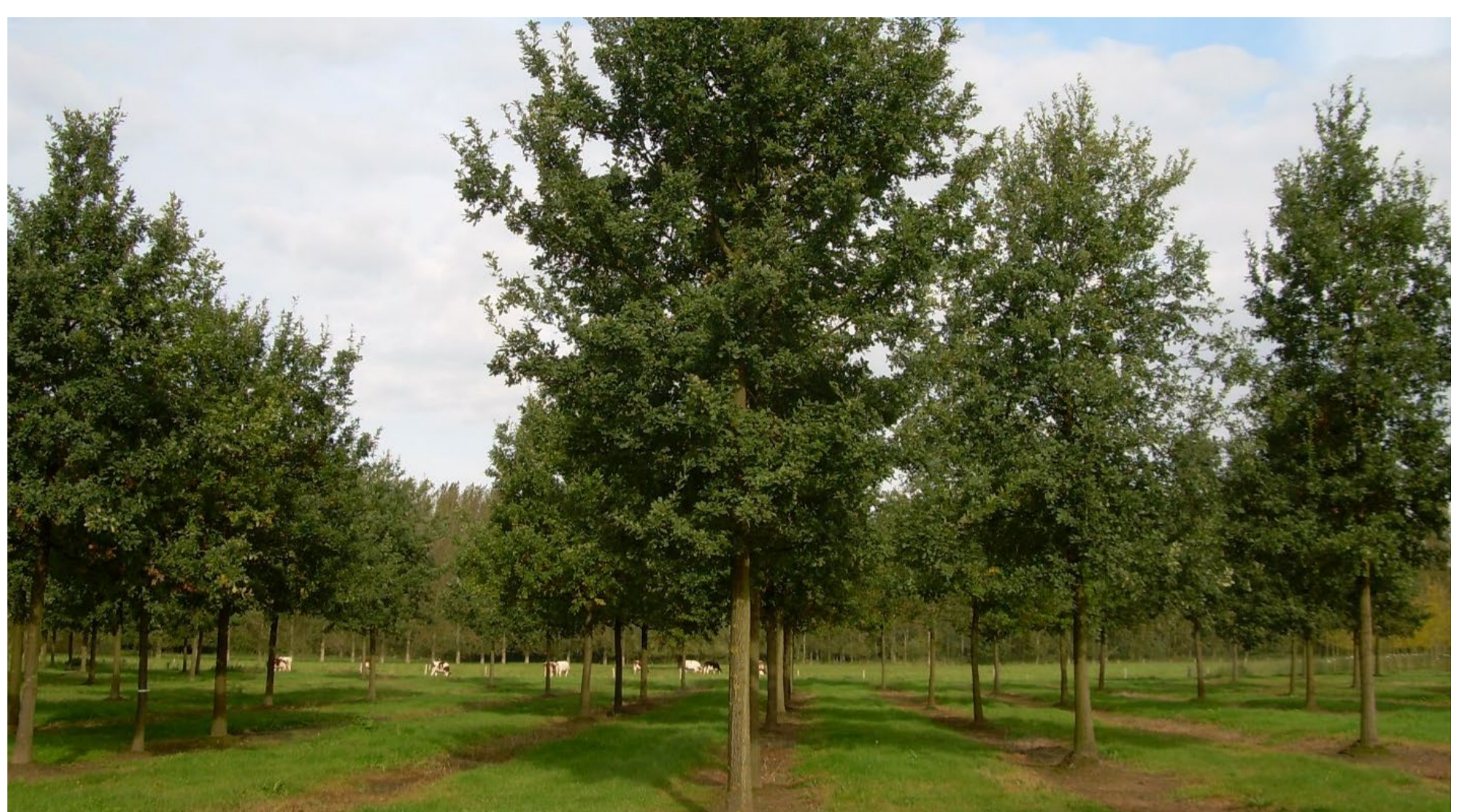
solitaire boom: zomereik