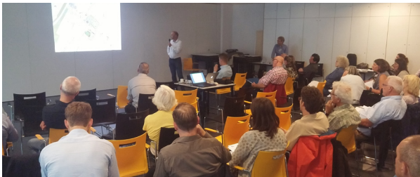
30-08-2017 Derde participatieavond Gebiedsvisie Utrechtseweg: Discussie over de drie scenario's voor een integrale visie.