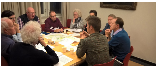
20-09-2017 Vierde participatieavond Gebiedsvisie Utrechtseweg: Werkgroepen over invulling op de thema's van de visie