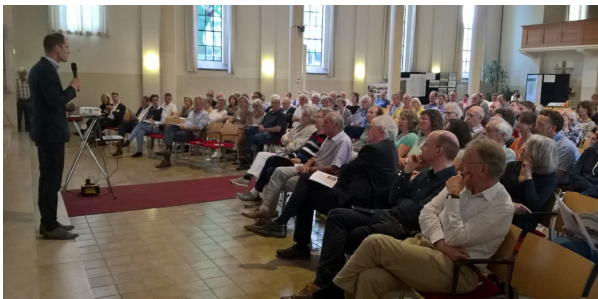
22-05-2017 Startbijeenkomst Gebiedsvisie Utrechtseweg: informerende van brede groep belangstellenden

Iedereen die betrokken is bij dit gebied, of zich betrokken voelt, is gevraagd om mee te denken en mee te werken aan de gebiedsvisie. Uit de aanmeldingen is door de gemeente een participatiegroep samengesteld die zo goed mogelijk alle belangen vertegenwoordigt. In verschillende workshops is de participatiegroep betrokken om actief en interactief vorm te geven aan de gebiedsvisie. In dit hoofdstuk worden de wensen van participanten verwoord in dromen, niet noodzakelijkerwijs direct te realiseren. Vervolgens worden de punten gerubriceerd die belangrijk gevonden worden. Tot slot wordt compact in een aantal slogans de aandachtspunten van de participatiegroep weergegeven.