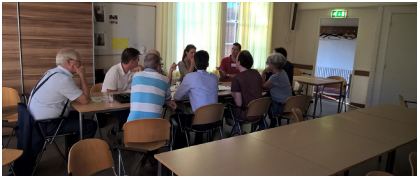
05-07-2017 Tweede participatieavond Gebiedsvisie Utrechtseweg: Werkgroepen over thema's en integrale uitgangspunten