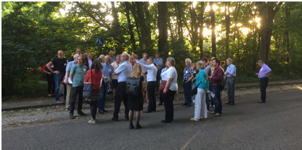
14-06-2017 Eerste participatieavond Gebiedsvisie Utrechtseweg: Presentatie themaanalyse gevolgd door een wandeling door het gebied